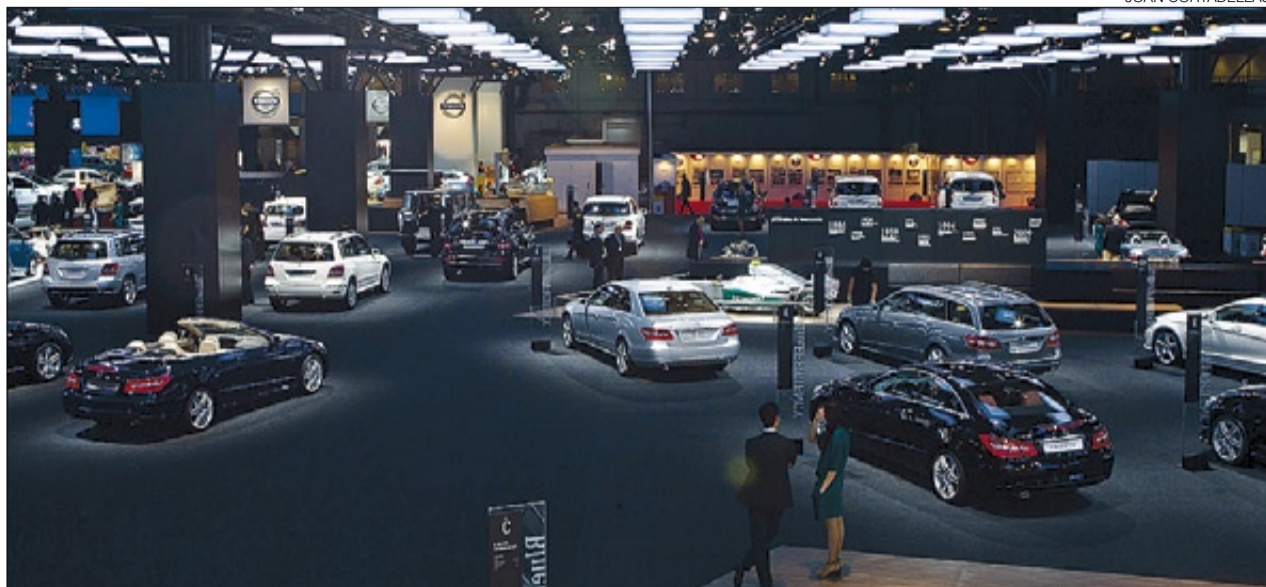
►► Zona de exposición del Salón del Automóvil de Barcelona en la edición del 2011.

A la vista de estas cifras, que levante la mano quien considere que la gestión de la crisis está siendo socialmente bien distribuida. Porque conociéndolas, uno no puede dejar de preguntarse: ¿Qué hubiera pasado si esos 60.000 millones de euros hubieran ido directamente a las familias en lugar de a los bancos? Esta capacidad adicional de pago, ¿hubiera podido solucionar el problema financiero de la banca sin perjudicar a las familias? ≡